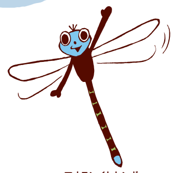
アオモンイトトンボ Ischnura senegalensis (トンボ目)